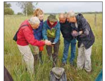
Ehrenamtliche Gebietsbetreuung umfasst u. a. das regelmäßige Begehen der Stiftungsflächen und die Koordination und Teilnahme an Arbeitseinsätzen. © Michael Succow Stiftung

Der Aufbau des Netzwerks an ehrenamtlichen Gebietsbetreuer*innen wird über das Projekt „NaturGut betreut!“ ermöglicht und von der Norddeutschen Stiftung für Umwelt und Entwicklung gefördert.