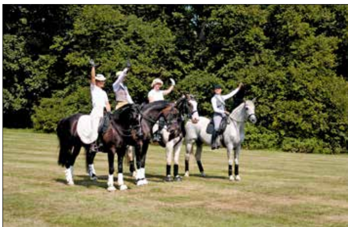
Das Pferdetheater während der Veranstaltung anlässlich der Inbetriebnahme des Springbrunnens im Putbusser Park am 08.08.2020