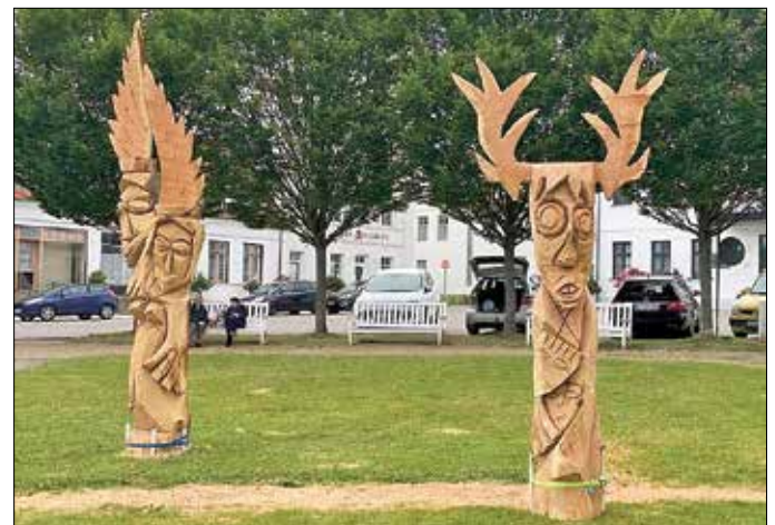
Masken der Welt im Zeichen des weisen Hirsches