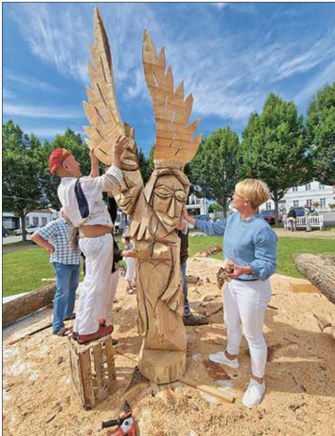
Die guten Geister von Fürst Malte & Luise beflügeln Putbus, die weiße Stadt auf Rügen