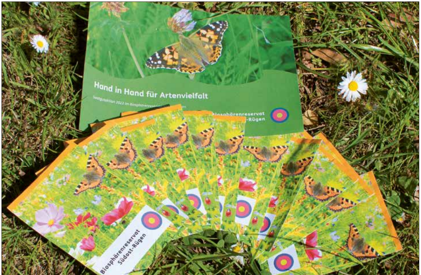
Blumensamentüten des Biosphärenreservates mit Infoblatt